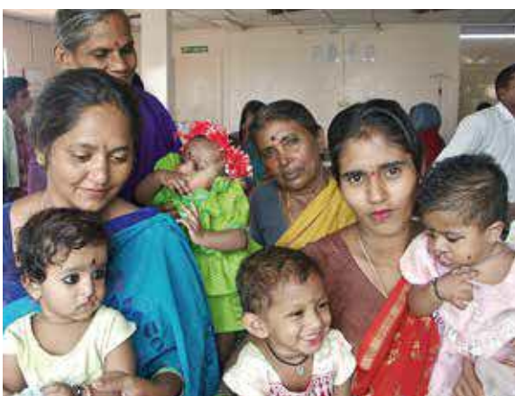
Im Wartezimmer des Spitals warten die Mütter geduldig bis die Reihe an ihnen ist.