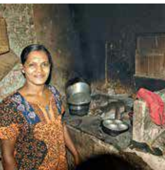
Eine Inderin zeigt uns stolz ihre Küche.