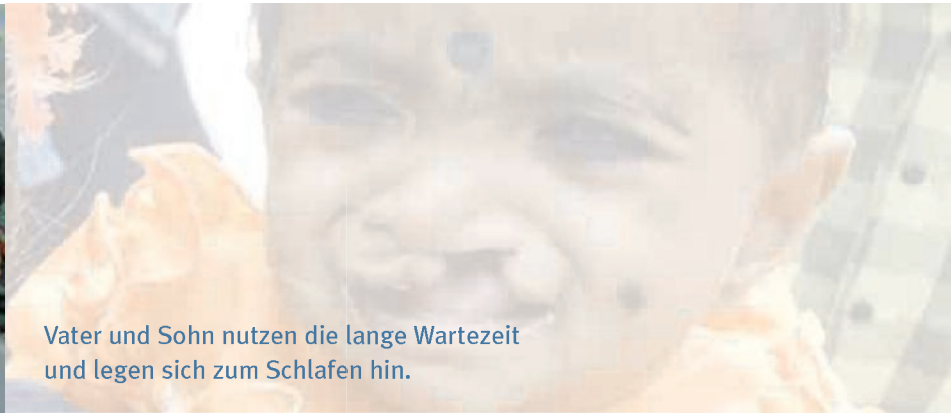
Vater und Sohn nutzen die lange Wartezeit und legen sich zum Schlafen hin.