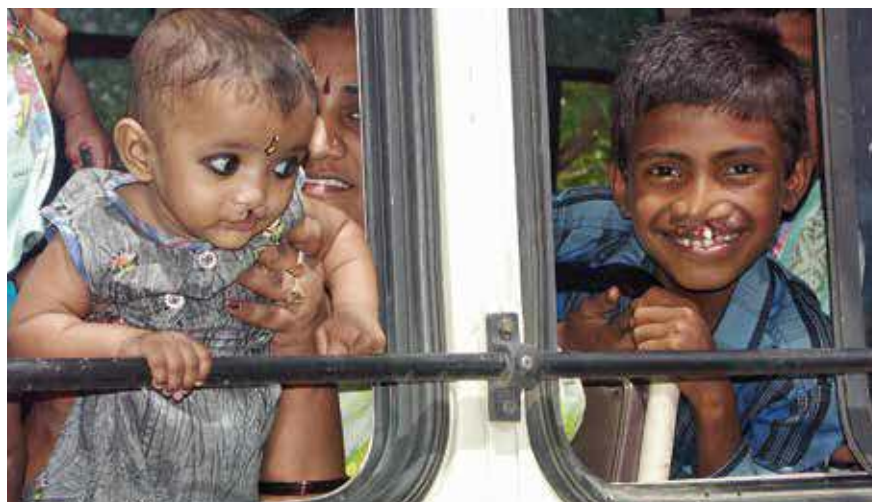
Der Bus ist im Cleft-Zentrum angekommen. Die Kinder schauen neugierig aus den Fenstern.