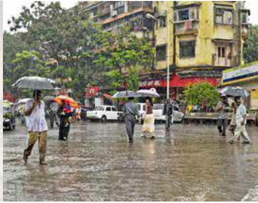
Monsun in Kerala