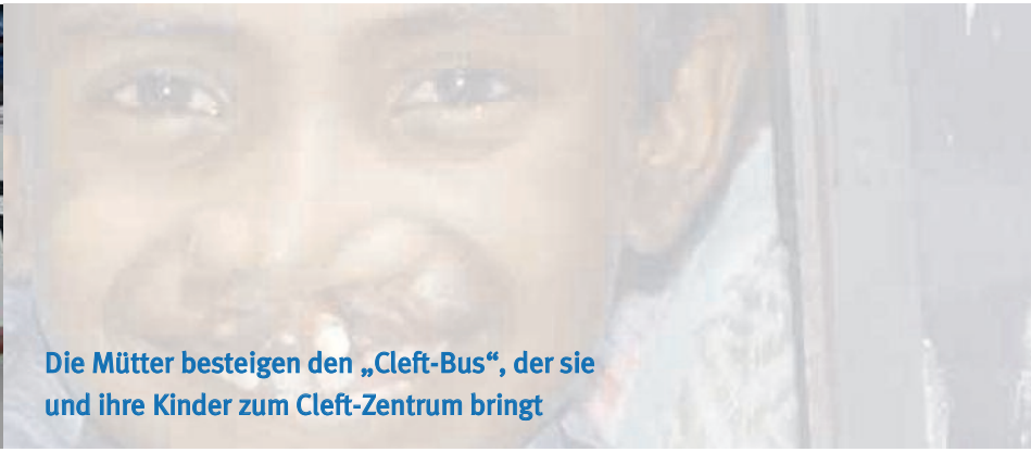
Die Mütter besteigen den „Cleft-Bus“, der sie und ihre Kinder zum Cleft-Zentrum bringt

Es wurden folgen Operation und Behandlungen in Mumbai durchgeführt: