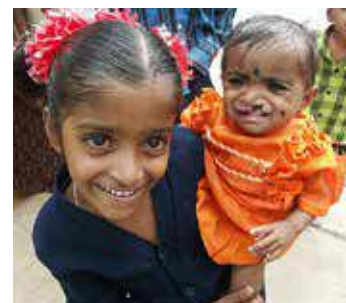
Dieses Mädchen tröstet die kleine Schwester, der das Warten zu lange wird.

Die Operationen wurden in den Hörsaal der Universität übertragen. Dort verfolgten mit grossem Interesse an der Operationstechnik von Prof. Sailer ca. 200 Chirurgen und Studenten die Liveübertragungen.