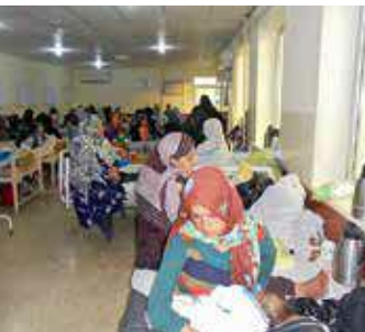
Das Wartezimmer von Kabul/Afghanistan ist überfüllt von Müttern mit ihren Kindern