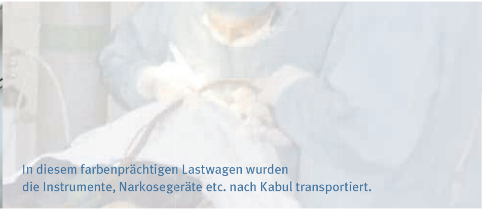
In diesem farbenprächtigen Lastwagen wurden die Instrumente, Narkosegeräte etc. nach Kabul transportiert.