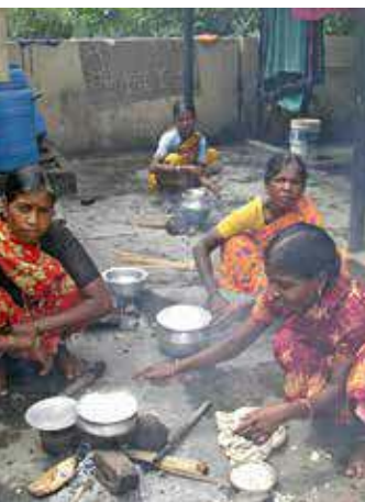
Gekocht wird im Hof des Spitals.