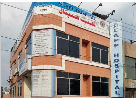
Das Clapp /Cleft-Lip-Hospital in Lahore/Pakistan

Er berichtete uns von den vielen Kindern die mit einer Spalte geboren werden, die jedoch ohne Hilfe nie operiert werden könnten, denn die Eltern haben einfach nicht genug Geld dafür. Grund zu dieser häufig auftretenden Gesichtsmissbildung sind einseitige Ernährung, Vitaminmangel, Folsäuremangel und wie oben erwähnt, die Heirat unter Cousin und Cousinen (Inzest). Uns war schnell klar die brauchen unsere Unterstützung sehr dringend. Die erste Operation die von CCI finanziert wurde fand bereits am 15.07.2013 statt.