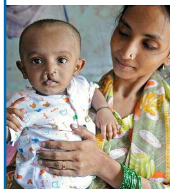
Eine junge Mutter wartet mit ihrem kleinen Sohn bis die Operationsschwester sie abholt.