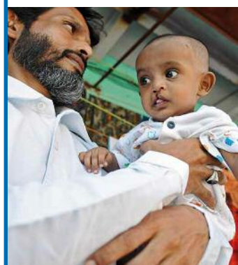
Obwohl der kleine Junge eine Spalte hat ist der Vater stolz auf seinen Stammhalter.