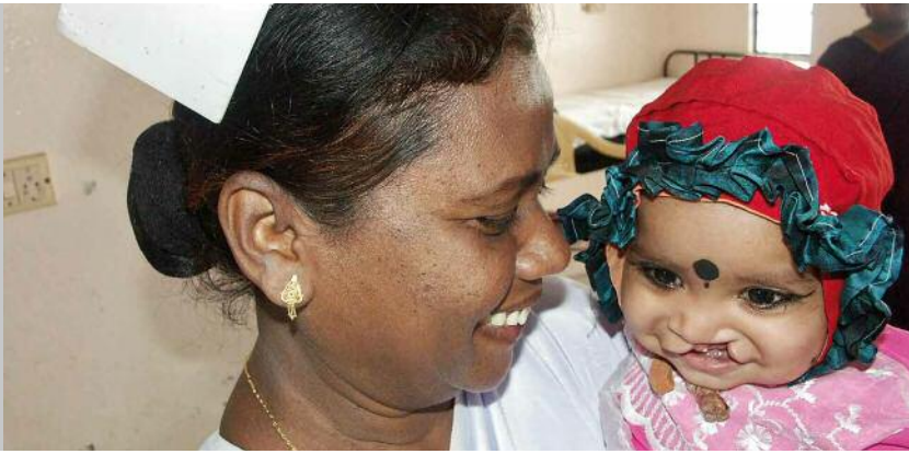
Die Kleinen werden sehr fürsorglich von den Schwestern betreut.