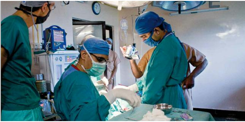
Das Cleft Team von Mangalore beim täglichen operieren