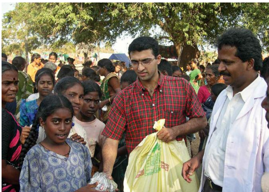
links Während eines Cleft-Camps werden „Lunchpakete“ an die wartende Menge verteilt, denn meist kommen sie von weit her und verbringen den ganzen Tag mit warten.