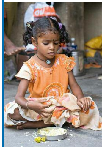
oben Das kleine Mädchen genießt ihre Mahlzeit, denn zu Hause fällt sie jeweils nicht so reichlich aus.